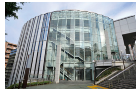
充実した教育セミナーも行う本社

する。それを裏付けているのが加工技術研究所（東京都羽村市）。トップソリッドシリーズの実証施設だが、試作部品加工を請け負っており、短納期で一品生産を引き